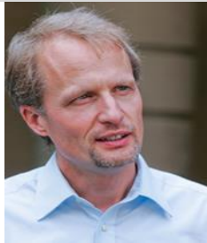
BEAT UNGRICHT PASTOR FEG WINTERTHUR