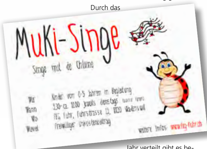
Flyer MuKi-Singe FEG Fuhr

Erlebt ihr, dass Gott dadurch Kontakte zu Familien/Kindern schenkt, die (noch) nicht zur Gemeinde gehören? Ja! Da wir das Angebot auf gemeindeferne Familien/Kinder ausgerichtet haben, entstehen sehr viele Begegnungen mit Menschen, die Gott nicht persönlich kennen. Sie halten sich in den Räumen unserer Kirche auf. Schwellenangst wird abgebaut. Wie vernehmen die Leute von eurem Angebot? Wir dürfen regelmässig unseren Flyer beim Kinderarzt und in der Bibliothek auflegen. Die Stadt Langenthal führt unser Angebot