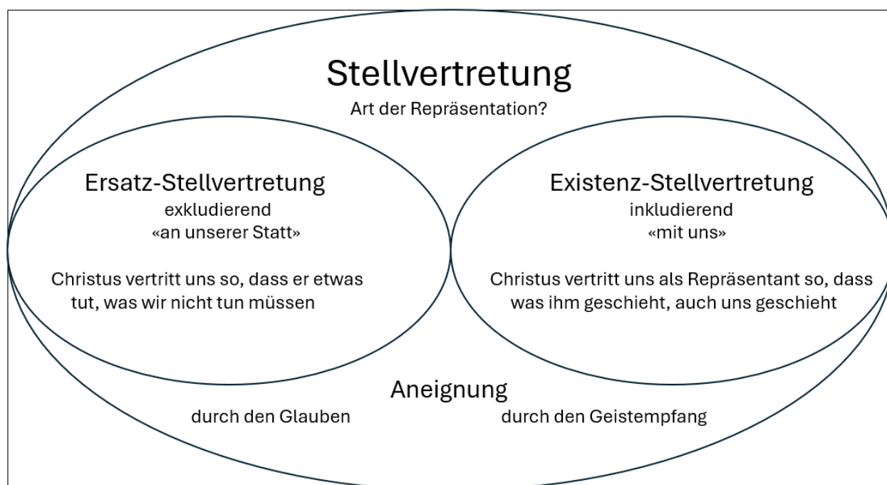
Abb. in Anlehnung an McNall, Mosaic of the Atonement, S. 102.

Anders bei der Existenz-Stellvertretung: Die Lehre von der Rekapitulation durch Christus als letzter Adam beschreibt das Erlösungsgeschehen auf einer anderen Ebene, nämlich als eine Existenz-Stellvertretung (wir haben mit Christus etwas in übertragener Weise erlebt, sind mit ihm verbunden). Beides gehört letztlich für den glaubenden und mit dem Heiligen Geist beschenkten Christen zusammen (→ dazu 1.4.2. ) und kann folgendermassen dargestellt werden: