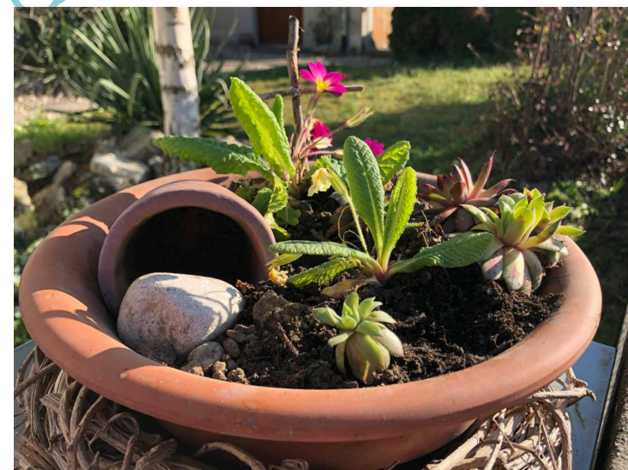
Osterschale – Entdeckt ihr das Kreuz und das leere Grab?

Die Anleitung für die Osterschale findet ihr hier: www.feg-kinder.ch/fileadmin/user_upload/kinder/Orange/Osterschale.pdf Von der Familie Maeder aus Murten haben wir dann eine wunderbare Rückmeldung mit diesem Foto erhalten >>>