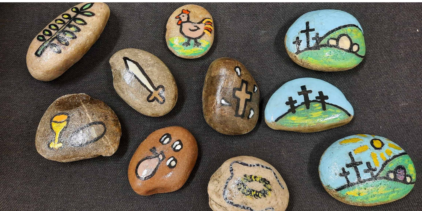
«Erzählsteine zur Ostergeschichte» von Natascha Hafke, Quelle: Facebookgruppe «Kirche mit Kindern»

Wir haben einige Ideen zusammengestellt, um die Passions- und Osterbotschaft mit Kindern zuhause oder in der Gemeinde ganzheitlich zu gestalten und weiterzugeben.